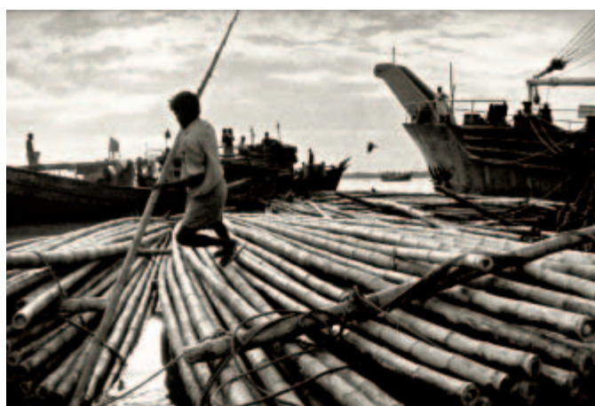
Emin Kadi: In Südafrika (Seite 10)