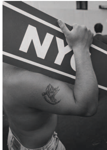
Links: Frieder Blickle fotografiert in New York; unten: Che Guevara fotografierte auch sich selbst; ganz unten: Helfried Weyer fotografiert die Wunder der Natur