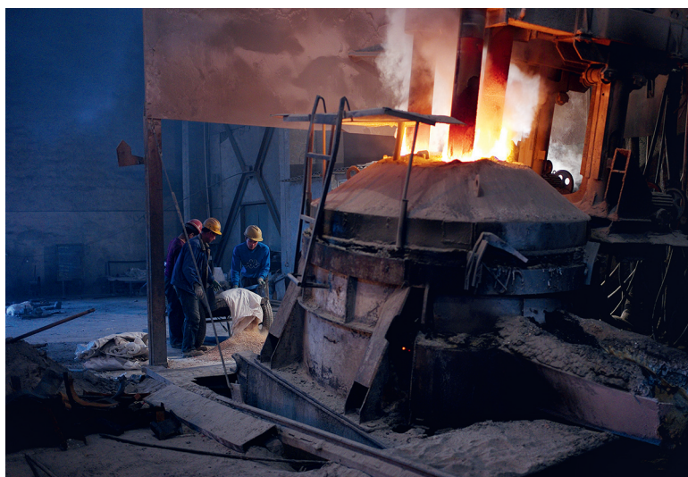
Der Abbau der Metalle der Seltenen Erden scheint Lichtjahre von den Hightech-Produkten, für die man sie benötigt, entfernt (ab Seite 26)