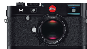
Die neue Leica M mit 24-Megapixel-CMOS-Sensor (ab Seite 50)

Lauter Unikate durch Be-leiderung nach Wahl und individuelle Gravuren