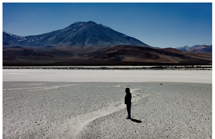
Constantine Manos: Moskau 1965 (S. 10) M-Sortiment: Leichtgewicht 2.8/28 mm, Schwergewicht 0.95/50 mm (S. 40) Tomás Munita: in der Atacama-Wüste (S. 26)