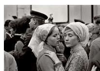
Constantine Manos: aus der Serie „Moskau 1965“