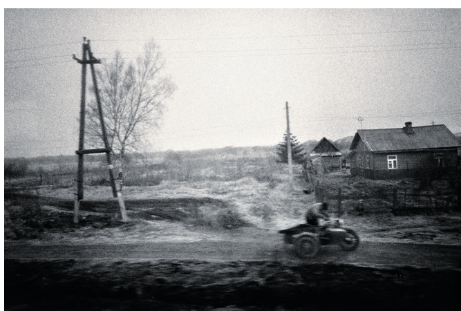
Thurston Hopkins: Joan Crawford in London, 1956 (Seite 6) Fotofestplatten: Digitalbilder sichern und sichten (Seite 34) Gert Jochems: Unterwegs mit der Transsib (Seite 56)