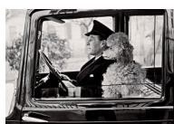
Coverfoto: Thurston Hopkins, La Dolce Vita, 1953