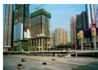
Coverfoto: Giovanni Del Brenna: Baustelle auf dem Kowloon Highway, Hongkong 2006