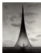
Coverfoto: Frank Röth, Sputnik-Denkmal Moskau, 1996